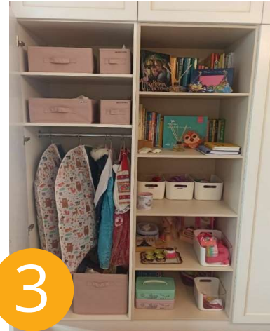
Детский шкаф для хранения одежды и предметов для творчества