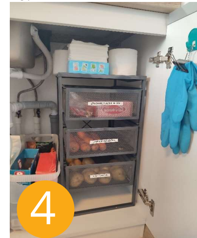
Организованное место под раковиной

Как мы видим, наша практика эффективна в любом сантиметре вашего дома!